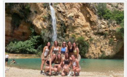
Een typische troep vrouwelijke aspiranten op bivak. Hoewel ze niet van het mannelijke geslacht zijn, hebben ze toch meer ballen aan hun lijf dan hun mannelijke tegenhangers.