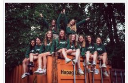
Aspiranten (2021-2022) na een super mega fantastisch leuk kamp

Enkele maanden na het voorjaar, in Juli, migreren de aspi's met de fiets naar een welbepaald gekozen plek om hun Bivak door te brengen. In deze periode ervaren ze het meeste plezier van het hele jaar. Zoals eerder vermeld, zijn de siësta's van uiterst belang in deze periode, deze schenken hun genoeg energie om de rest van de dag te trotseren. Hoewel de dagen zwaar en vermoeiend zijn, genieten de aspi's van gemane programma's en hilarische momenten. Na kamp keren de uitgeputte aspiraten voldaan met het openbaar vervoer naar huis.